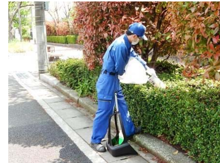
会社外周部の清掃