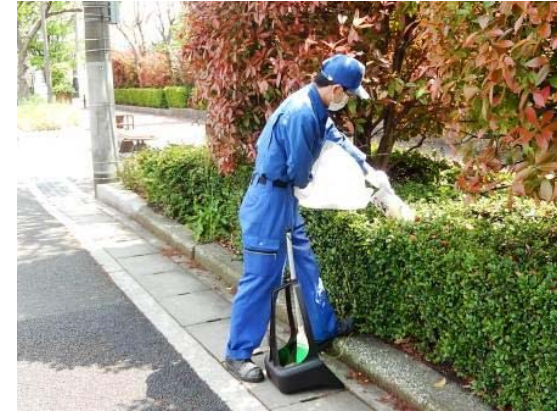
会社外周部の清掃